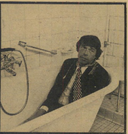
ז'אק ברל ב"גודניק" הם גיבורים באמבטיה

*** התפוז המיכני (ירושלים, ארצות-הברית) — אזהרה נוראה למי ש"נידמה לו שמדובר בעולם העתידי. ה"עתידי הזה של אלימות חסרת סיבה, וניסיון לעוקרה בדרכים של ניתוחי-מוח, שלש כבר להווה.