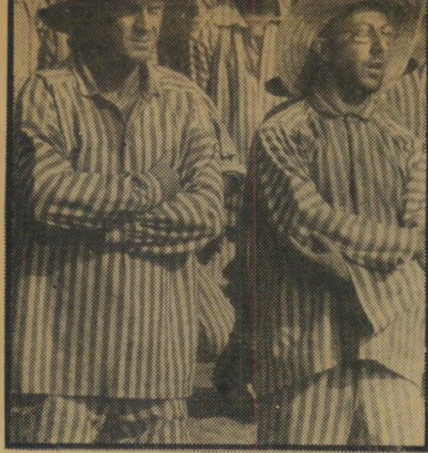
הופמן ומקווין ב"פרפר" האנטיג'יבורים

צרפת) — סרט זה מכיל בתוכו יסודות השאלים מכל הסגנונות האפשריים. זוהי קומדיה מטורפת, וזהו סרט-מתח, וזו גם מלודרמה רגשית, ועוד ועוד. הכל בתוך סיפור על גנגסטר שמתפקידו לרצוח עד חשוב, העומד לגלות את קלפיו של העולם התחתון בפני בתי-המשפט, ועל סוכן מכירות שלומיאל המנסה להתאבד מפני שאשתו עזבה אותו והלכה לחיות עם ה"פסיכיאטר שלה".