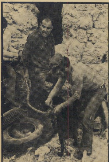
כלב ג' מוצא מהכאר תוך פרשת הכור