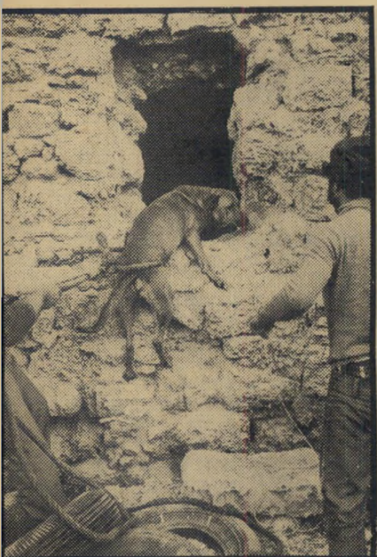
כלב ב' מוצא מהכאר מחושך לאור

סיפוק עצום. הרגע המרגש ביותר היה זה בו יצאו הכלבים לאור העולם.