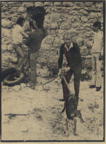
כלב ב' מוצא מהכאר מכלא לדרור