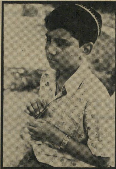
תלמיד שבת "נחנה מכות במקל"