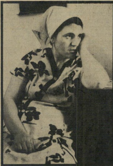
אמא שבת "מורה הרביצה לו"

סיפרה המורה בעדותה בבית-המישפט: "בכיתות ד' ויה' היה מכלוף תלמיד מצ" טיין. תמיד סיפרתי עליו והתגאיתי בו. אבל בכיתה ו' החל להידרדר, לא ברור לי מדוע. סיפרתי לאימו שהוא לא לומד ור שהוא חצוף ומפריע, והיא אמרה לי שר אעשה לה טובה ואכה אותו. הכנתי אותו באותו יום כשלוש מכות קלות בכתף ימין, וצבטתי אותו צביטה אחת. הוא אומנם בכה, אך לא משום שכאב לו - אלא מפני שנפגע."