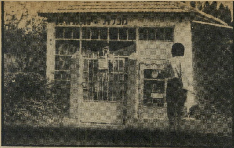
המורה ציפורה (מאחרי השער) "עשיתי מה שצריך"

תלמידי בתי-הספר שחזרו ללימודים ב- תום חופשת הגיהנום, מצאו עצמם במעמד חדש: כ"סופגיימכות-מורשים לפי החוק."