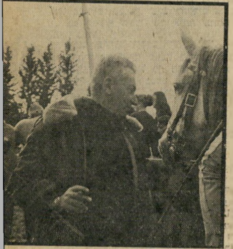
השר ברירב על סוסים ואנשים

לחיות כ-5 מיליון לירות, לולא ארבעה חודשי השיתוק עקב המילחמה. לבידי אשקלון פותח בימים אלה מח-לקה חדשה ליצור פורמיקה, בה הוש-קעו 2.5 מיליון לירות. המחזור הצפוי לשנה הקרובה הוא 100 מיליון לירות.