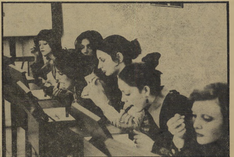
משתתפות תחרות מלכת-המים מיהרו לנסות על עצמן את מוצרי-האיפור של "הלנה רובינשטיין", לשוות להופעתן את מראה-האקוורל החדש, הרך והעדין, התואם את האקלים הישראלי.