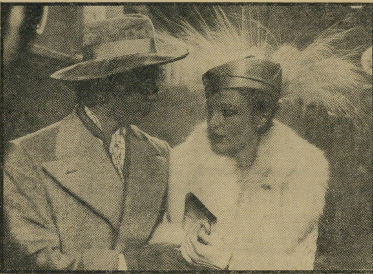
ביסט ויורק ב"אורינט אקספרס" גם היפים חשודים ברצח

פאסר, ברנש המתנשא לגובה של שני מטרים, התנגש לראשונה עם העולם התח"ת תוך בהיותו בן 19 בלבד. אז האשים את אחד מבתי-ההימורים שבאיזור במעשי-רמאות, והתוצאה היתה שאושפז בבית חולים ונזקק לעשרות תפרים ותיקונים פלסטיים. כשהור לאיתנו נטל פאסר נבוט, יצא לשלם למהמרים באותה מטבע עצמה, ומאז מינה את עצמו כמטהר, מרכזי הקניות לחוטאים, כפי שכינה את בתי ההימורים במדינת מיסיסיפי. הטיהור נעשה, כמובן, בעזרת הנבוס, והוא עצמו הודה שלא פעם "כופף" את החוק לפי צורך השעה. אחרי קאריירה פורחת שכללה מיספר בלתי-מבוטל של קטטות, חילופי-אש וקרבות-אקדחים, נפל פאסר קורבן למלכודת, שעה שנסע עם אשתו במכונית. האשה נהרגה, ואילו גופו ובעיקר פניו נפגעו בכדורים רבים וצורתו החזרה לו רק לאחר 16 ניתוחים פלסטיים שונים. בגירסה הקולנועית, אותה מגדיר פאסר כ"80 אחוז אמת ו-20 אחוז דימיון קולנועי", מוצג השריף הקשוח באור סימפטי וחיובי הרבה יותר מכפי שהוא במציאות.