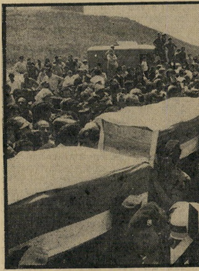
אלפים איש המומים ליוו את 16 קורבנות הטבח, שארונותיהם כוסו בדיגלי-הלאום, אל מנוחתם ור הפך במהירות להפגנת זעם כנגד השלטון.

יום קודם-לכן שפכו בני קריית-שמונה את זעמם על שרידי גופות הרוצחים, ש' התרסקו לרסיסים בתוך הדירה ממנה קצרו את קצירי הדמים שלהם. הם התנפלו על השוטרים שהוציאו את שרידי הגופות על אלונקות, שרפו אותן באמצע הכביש, בהלווייה נידמה היה שההמון אחוז האמוק עומד לעולל לנציג ממשלת-ישראל מה שעוללו לגופות המחבלים. באגרופים קמוצים ובוזקות-שבר התנפלו בני-העיירה