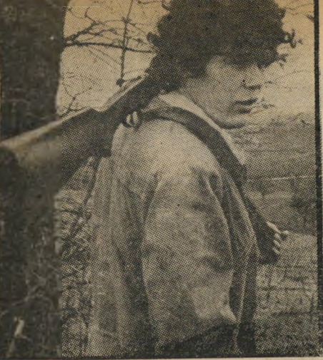
שחקן בלאז כל השכנים — מקנאים

כל זאת, עד שהוא נתקל במישפחה יהודית המסתתרת מפני הנאצים, ומעין רגש חדש, אהבה שטרם טעם טעמה, קושר אותו אל הבת הצעירה. באותה קלות בה הצטרף לגיסטאפו הוא נרתם עתה לעזרת