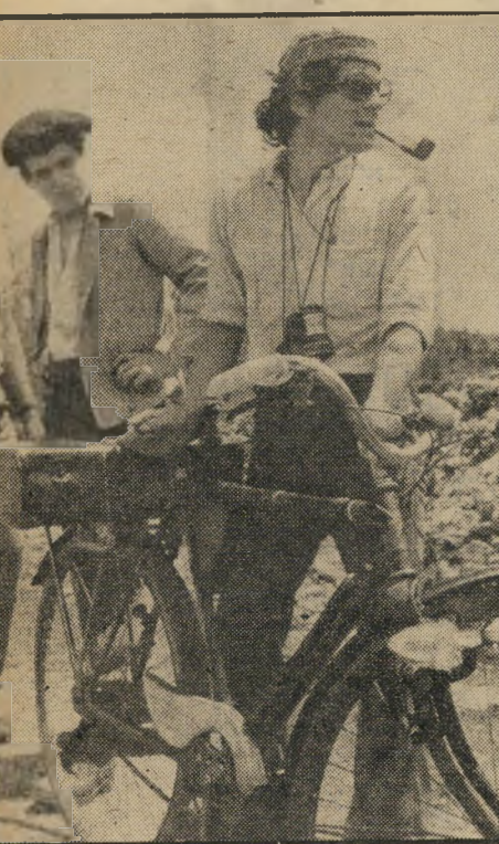
במאי מאז כל השחקנים — אלמונים

גיבור הסרט הוא בחור בן 17, לא חכם במיוחד, לא יפה במיוחד. שמו לאקומב לוסיי. אביו — שבויי-מלחמה; אמו היה עם ראש העיירה הסמוכה, ובית-המישפחה נפל בידי זרים. הבחור עובד בבית-החולים המקומי, מבודד ומנותק מן החברה. הוא עורף ראשי תרגולות במכת-גרזון יחידה, צד ברובה העתיק של אביו ארנבות רבות