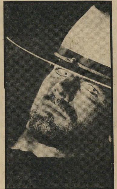
היה בקי טובים כל המערבונים — טפאטי

★ אין עשן בני אש (1953, צרפת): מלודרמה פוליטית על ניסיון להשיג חיר פני מועמד לראשות-העיריה בעזרת פוטמונטאו, המראה כביכול את אשתו מתעלסת באורגיה, עם גבר זר. בעייתון מישפטי הנושא את כל סימני-היהוה של הבמאי, אנדרה כאיאט (למות מאהבה). כאיאט שואל פה ושם רעיונות מאנטור ניוני או מפאולוני, אבל ביסודו אינו מציג ליה לעולם להינתק מדימעה הגונה, מהט פה צידקנית ומכמה חיצים לעבר המערכת