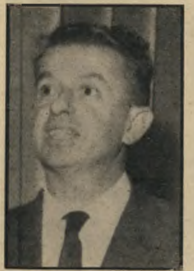
מנכ"ל עורד מסר הכל נשאר במישפחה