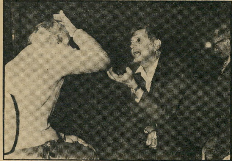
נגרלים (מיל) נבע ושהם גם אם תרצו...