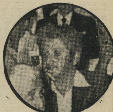
מנכ"ל שטריופטר איך להשיג