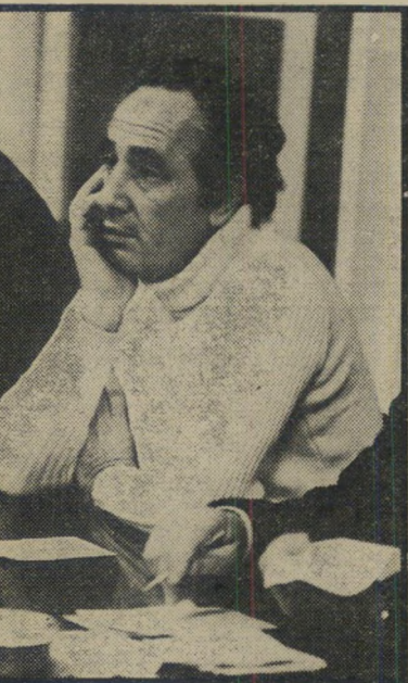
שריהתעמולה פרס המיבטן הראשון

ערב הצגת ממשלתה החדשה בפני הג'נ'רל היתה ראשהממשלה גולדה מאיר טרודה עדיין בבעיית האיוש של שלושה תיקים בממשלתה החדשה. היו לה שלושה תיקים פנויים: התחבורה, העבודה וההס'ברה. היו לה גם שלושה מועמדים לתפ'