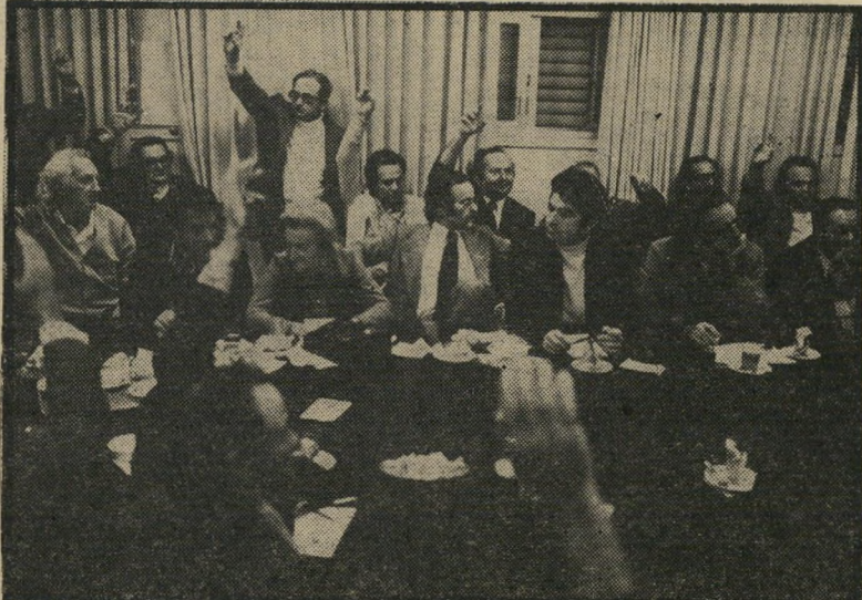
ההצבעה אנשי צבאו הפרטי של הגנרל דיין מרימים את ידיהם בתום דיונים מייגעים שנמשכו יותר מארבע שעות, כשהם מצביעים בעד החלטה בנוסח "חצי תה וחצי קפה", הקוראת לחקמת ממשלת חירום לאומית, אך לא לחצביע נגד ממשלת מיעוט, אם גולדה- מאיר תקים ממשלה כזו.