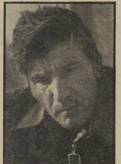
עסקן ברוכיאיני יבורך ברוכיאיני

אילו היה אדם פרטי או מוסד פרטי נתפס בעבירות מעין אלה, אין ספק שהוא היה נתבע לדין על-ידי שלטונות המס במדינה. כיוון שכאן מדובר באגודה צי-בורית של הפועל נשאר הדבר בגדר עניין משפחתי. למרות דו"ח המבקר לא הוסקו מסקנות אישיות לגבי עסקני האגודה ו-איש מהם לא נתבע לתת את הדין על ה-ניהול הפיקטיבי של מאזן כספי האגודה. כאשר נשאלו כדורגלני הפועל ירושלים,