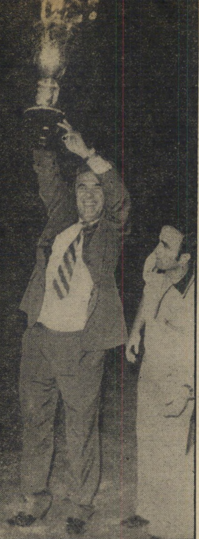
עסקן משולם משולם משולם

לפרשה כולה יש היבט נוסף. אפילו אם נניח שזכותם של אנשי הטלו-ויזיה להעדיף לתפקיד קריינית-הרצף, נע-רות הקרובות לבניין מוכרות להם. מדוע היה צורך להוליד שולל 600 נערות אחרות ולטעת בליבן תיקנות-שווא? יתירה מזאת: מדוע צריך היה לקחת מכל אחת מהן, דמי-הרשמה בסך של 50 לירות, המסתכמים בסכום כולל של כ-30 אלף ל"י, כשהיה ברור מראש שבתפקידים הניכספים תזכינה בנות-החסות של המקור-רבים לצלחת?