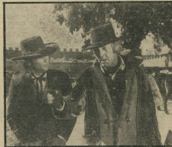
קוברן וכריסטופרסון: למות בן 21

כל הסממנים האופייניים לפקינפה מופיעים בסרט בהבלטה: התפרצויות אלימות, מפורקות למיכביהן בתנועה איטית, ילדים המשחקים עם המוות (במקרה זה עם הבל' תלייה), התעללויות סאדיסטיות, עריכה מרתקת של סצנות פעילות, ועוצמה בלתי רגילה של התמונות בהן מתמוגגים האנשים עם התמאורה או הנוף שמסביבם. אילמלא נודעה העובדה שהסרט קוצץ באכזריות עוד