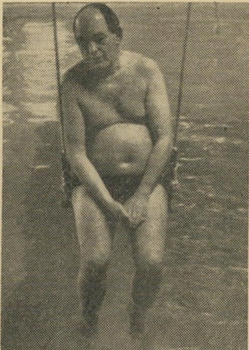
"הזכו ששידירות הזכו..."

זוטא: ברור שההשפעה היא אפסית. אם ניקח לדוגמה משפחה שהכנסתה ה- ממוצעת לחודש היא כ-850 ל"י נטו