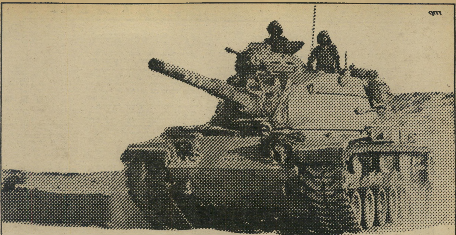
M-60. Made in U.S.A.