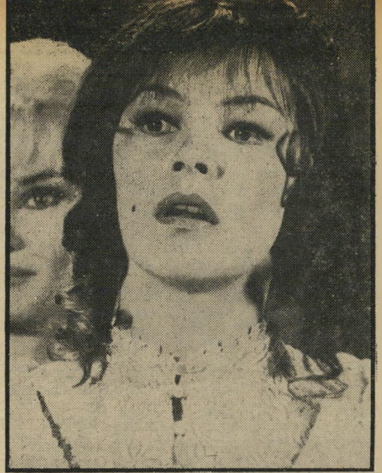
גלנדה ג'קסון ב"נגטיבים", "מרי מלכת הסקוטיות" וכחיים לא מספיק יפה