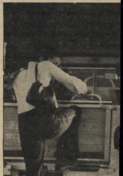
לתת אפשרות לחייל שרץ מאחור להי לטנדר הצבאי, שלא עצר לחיילים ב" בר ארגז הטנדר הצבאי והחלה לטפס עליו.

גם שתי מכוניות צבאיות עצרו לצלילה, טנדר סוסיא וכרמל. אנהגים הצבאיים,