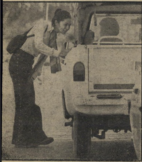
הגיבניה נהג צבאי ג'ובניק לא עצר לחיילים, למרות פקודות מסכ"ל המחייבות אותו לכך, עצר לבחורה שעמדה אחרי החיילים.