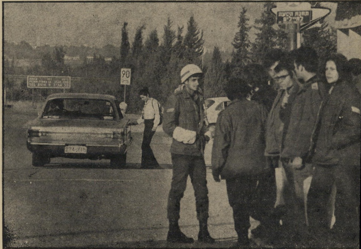
מכונית ריקה, שנהגה מתעלם מהחיילים העומים דים בטרמפיאדה — ועוצר לעומת זאת לצעירה. המכונית שלי עמו' סה"ה הסביר הנהג כתשובה לשאלת הכתב, מדוע לא לקח חיילים.