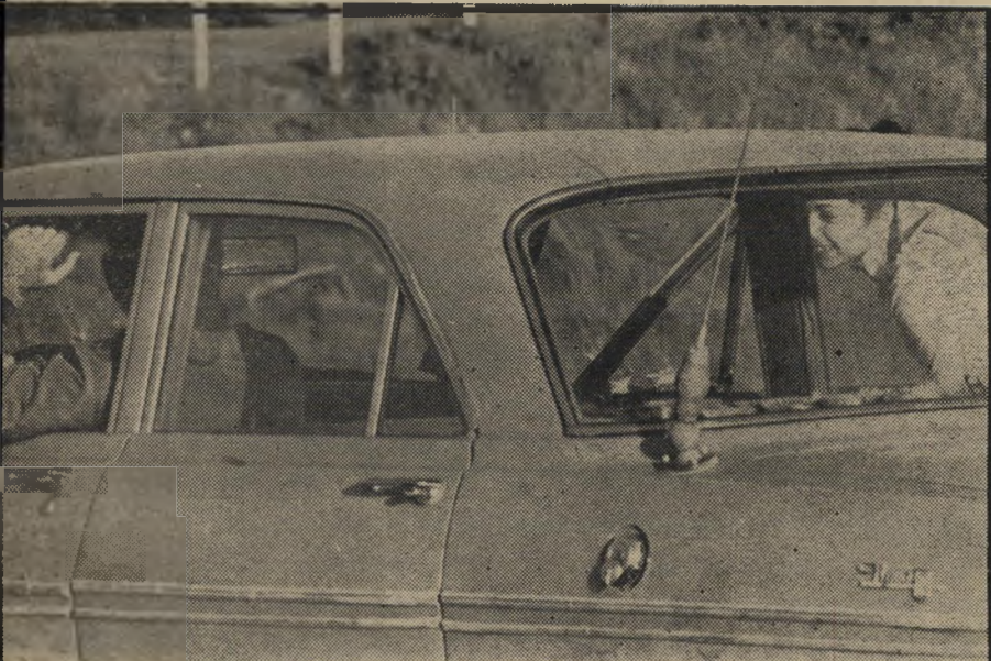
חירוצים צלילה כשיחה עם הנהג, בעל מסעדה בנתניה, אשר עצר לה — וסירב לעצור לחיילים. למרבית הנהגים היו תרוצים שונים ומשו' ים, לשאלה מדוע לא עצרו לחיילים ביכרו על פניהם את החתיכה הבודדה.