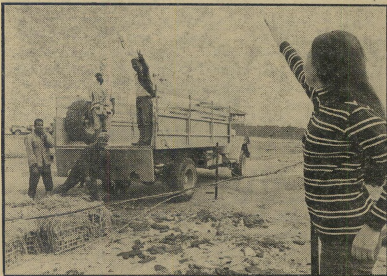
רונית נפרדת מן הערכים כשיורה האחרונה לפואץ — לכיסוי אירוע

היה ברור שהמופע מעודדהמורל ביותר, לחברה המתייבשים זה שלושה חודשים במידבר ובאפריקה — הוא הופעתן של שאפות מצוחצחות, מריחות, מגונדרות, בתוכם גם לצמרת צה"ל היה הדבר ברור — אולם הם חששו מהתנהגות בלתי-נאותה של החיילים. המחזה של חצי תריסר חתיכות מדגמנות בגדים ומחשופים בקרב נחילי החיילים — עורר סיוט בדמונם. בשבוע שעבר, לאחר שהתגברו על היסוסיהם — נוכחו לדעת שלא העריכו את החברה נכון. לאורך עשר תצוגות, ביום ובלילה, וכן במסיבות ובארוחות משותפות — כשהבנות נמצאות בקירבה הדוקה עם החיילים. לא אירע אפילו מקרה יחיד של התנהגות בלתי נאותה, של רמז קל ביותר לגסות. הבנות נשטפו בגלי כבוד, הערכה ואהבה. תוכל לראות זאת בכתבה בעמודים 29-32.