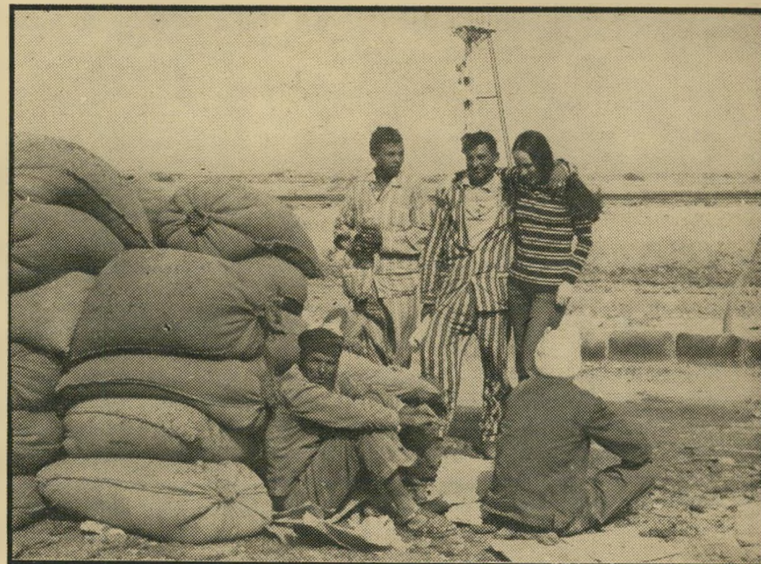
חיבוק ערבי רוג'ית חבוקה עם סבל ערבי, אחד מקבוצת הסבלים העוסקים בהעמסת ופריקת האספקה לחיילי הארמיה השלישית.

אי-אפשר היה לקלוט את המוסיקה בי רדיו, לא היה בשטח כל טייפ, וכך רקדו להם הזוגות, כשכל זוג שר, מהמהם, או מזמזם לעצמו את מנגינתו. אחרי הריקודים החלה השירה. שירה אדירה, שירת צנחנים, עד ארבע בבוקר. או אז הגיע אורח נוסף לשמחה: היה זה אחד החברה ששכחו להעיר אותו: „באמת היה נדמה לי שאני חולם שאני שומע קולות של בחורות.“ מילמל. התצוגה הבאה התקיימה למחרת בבוקר — בבית-הסוהר בסואץ. ומשם, הלאה: לגדות המעבר של הי אספקה לארמיה השלישית. הנוף המידברי