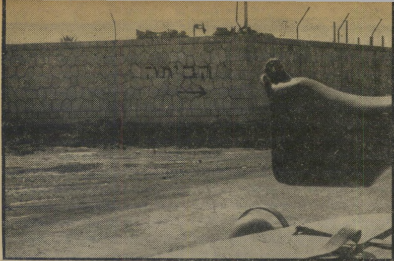
ג'יפ ככיוון הביתה בארץ גושן זעקה בחצות הלילה

בפעם הראשונה נסוג צה"ל. אמנם, גם בשנת 1957 היתה נסיגה גרוי-לה. אולם זו עברה כימעט מבלי להשאיר רושם, כי בראשה עמד דויד בן-גוריון, האיש שהוביל את צה"ל זה עתה לניצחון