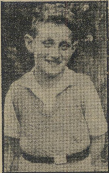
בן 10 בגרמניה חיתוך דיבור ייקי

הנרי קסינג'ר ידע זאת. אבל הוא נמשך אל הפוליטיקה. אחרי שבילה