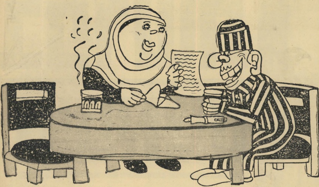
(הבעל קורא לאשתו את המכתב שכתב לבן בחזית: „יש לנו חה וסוכר ובשר, ולא חסר לנו מאומה. קיבלנו גם את הפסונים והסנטוריונים ששלחת. כלמה שאנו חסרים, זה לראותך.“)

כאשר התפרסמו קאריקטורות אלה בשבועון המצרי סבאח אל חיר („בוקר טוב“), בגליונו מלפני שבועיים, עוד היתה הפרדת הכוחות – המשמשת כיום נושא בלעדי בעיתונות המצרית – בגדר תקווה לעתיד בלבד. משום כך, מאלף לראות כיצד נראו בעיני המצרים הנושאים האקטואליים דאז – ישראל, מלחמת הבחירות בה, החיילים בחזית. אוסף הקאריקטורות בעמודים אלה, החושף כיצד נראים הדברים מהעבר השני של התעלה, מורכב מסיגנונות שונים: ישנן קאריקטורות אנטישמיות קלאסיות, כמו זו של מודעת הבחירות של גולדה, או זו המשווה את דיון להיטלר (דבר המלמד רבות על אינולותה של האמונה הרווחת בישראל כי „דיון הוא היחידי המסוגל לדבר עם הרעבים.“) ישנן לאומניות גסות, כמו זו המציירת את החייל הישראלי העלוב מול המצרי המפואר. וישנן אינטליגנטיות יותר. בין התופעות הבולטות, בקאריקטורות אלה – והעשויות להפתיע את הישראלי הממוצע – הקנאות העצומה שמגלים המצרים להחזרתו של סיני לריבונותם, והחשיבות ההיסטורית האדירה שקיבל בעיני השושי לאוקטובר.