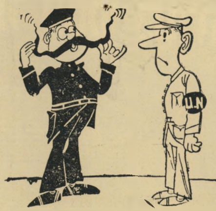
(החייל המצרי לחייל האו"ם: „אינני מבין איך אתה מסוגל למלא את תפקידך בלי דבר כזה“)