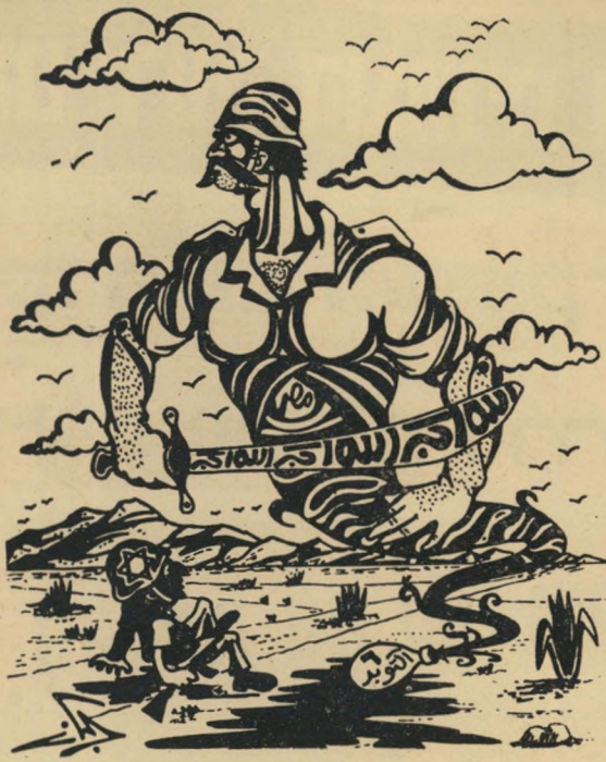
(„אללה הוא אכבר“, חרוט על חרבו של הג'ין שיצא מהבקבוק, שהוא ה־6 לאוקטובר, והמאייס על החייל הישראלי המתמוטט.)