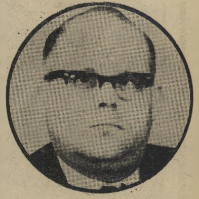
בנקאי מן מופת ציבורי