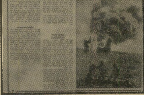
שריפת אבו-רודס: "העולם הזה" 9.1.74 של נימוקים ביטחוניים

האפשרות הניתנת לאזרחי ישראל לקבל מידע חיוני ב"נושאים המכריעים לגבי גורל המדינה, רק באמצעות ציטור טים של עיתונות חו"ל, מאי"רה באור קודר את האשליה של עיתונות חופשית במדי"ת ישראל. אמתלה המפוק"פת של נימוקים ביטחוןיים גיים, נטלה בידיה בישראל קבוצה קטנה של מנהיגים את הזכות להחליט מה מותר ומה אסור לציבור לדעת, לא רק בנושאים ביטחוניים, אלא גם בנושאים פוליטיים, כלכליים ואחרים. מאחר שניתן להחיל את תירוק ה"ביטחון" על כל אחד מתחומי החיים בישראל, נוצר מצב האופייני רק למדינות טוטאליטריות, בו מועבר המידע לציבור דרך מסגרת קפדנית הבוחרת להזרים את המידע לפי האינטרסים של עצמה בלבד. זוהי לא רק שיטה פסולה המנוגדת לאורח החיים הדמוקרטי, אלא גם שיטה בלתי יעילה. מה שאירע במלחמת יום-הכיפורים צריך היה להוכיח לנוגעים בדבר עד כמה נואלת וחסרת-ערך היא שיטה זו. שאינה פוגעת באויב אלא באזרחי המדינה עצמם. אבן הפינה של כל מישטר דמוקרטי היא זכותו של כל אזרח לדעת, לקבל מקסימום של מידע שעל פיו יוכל להכריע ולבחור בצורה חופשית ביום האחד בו נמסרת ההכרעה בידו. ונשאל יסוד זה אינו קיים כלל בישראל. הפירסומים הרבים בעיתונות חו"ל, על נושאים שונים הקשורים בישראל, שבחלקם הם מוטעים ומסולפים, יכולים רק ללמד את הציבור בארץ עד כמה מעט הוא יודע על הנעשה באמת בישראל. מלחמת יום-הכיפורים לא לימדה דבר ולא שינתה דבר. כמו בתחומים אחרים, כך גם בתחום חופש הפיר"סום והעיתונות, נשאר הכל כפי שהיה: אותם האנשים,