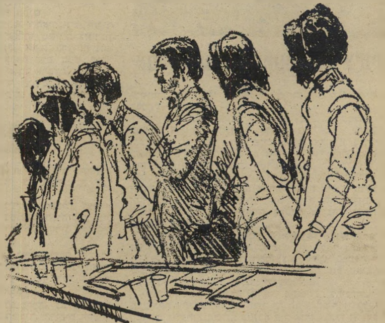
ששת הנאשמים בבית־המישפט.