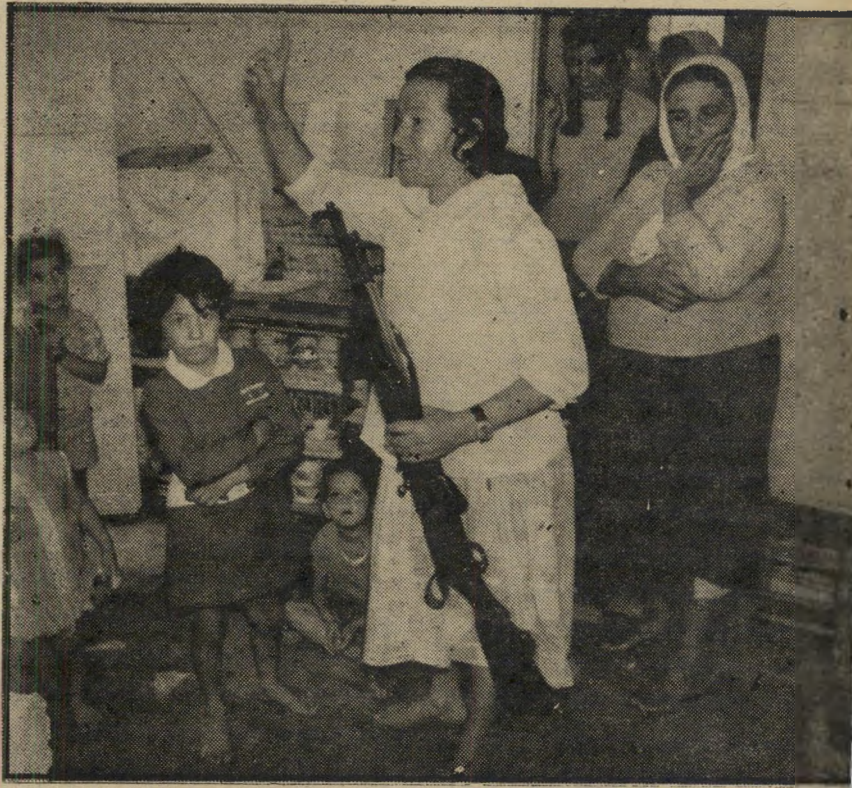
במחנה: אמו של אחד המחוקקים שנהרגו במינון

ה ערבי הצעיר שישב מולי נופף את ידיו בהתרגשות. עיניו נצצו. „לא! לא! לעולם לא! לעולם לא נסכים למדינה פלסטינית קטנה, מיני-פלסטין!“ זה היה לפני שלוש שנים. סיימנו זה עתה ויכוח פומבי ברדיו ז'נבה. בן-ישי חי היה סטודנט פלסטיני, נציג בלתי-רשמי של „האירגון לשיחור פלסטין“. כעבור זמן מה מת מסרטן — ואז נתברר שהוא היה מעורב בתיכנון הרצח במינכן.