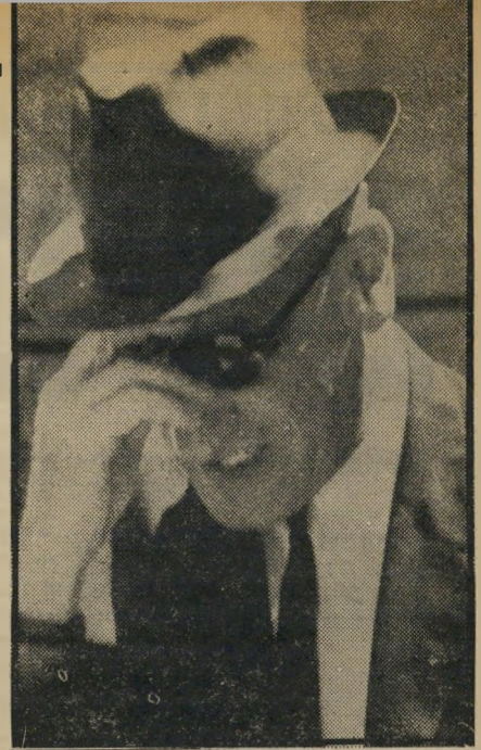
מבקר המדינה נבנצאל

שילם דיין תמורת האמבטיה מכספו. או שמת נעשה השלום עלייך משלחת ה"קניית של משרד הביטחון בארצות הברית? האם קיבל שר הביטחון הקצבת מס' בעתו לרכישת אמבטיה בארצות הברית, מהסוג שניתן לרכוש אותה בישראל? האם שילם שר הביטחון לחברת הת"עופה הממלכתית אל"על, תמורת הטסת ה"אמבטיה מארצות הברית לישראל? האם שילם שר הביטחון את המכס הניגבה ממוצרי יבוא של מתורות מסוג זה?