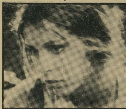
שחקנית מוחר אל תוך עצמנו

סרטים של אחרים, עבר הרצה בכמה טר' טים קצרים משלו (אחד מהם, לפי הרוצ' חים של המינגווי, שימש כבר השארה ל' מיספר סרטים באורך מלא), והגיע עתה אל ההתמודדות הגלויה עם הקהל. שלום, גיבור סרטו של יקי, מגולם על-ידי הבמאי עצמו, הוא בן למשפחה בורג' ניה ממוצעת, חי באחד מאותם בתים משותפים של הישראלי הכצוני, וסובל מ' מועקת בני הדין.