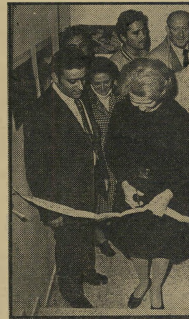
אשת השגריר פותחת החנות ביי חובות

הבעייה העיקרית של החברה היא השגת אניות להובלת סחורות. עד לאחרונה הרי בילה צים רק מיטענים בסחוניים, ורק עתה הסכימה להוביל גם מיטענים אורחיים. למרות הירידה בהיקף המכירות, לא נפגעה החברה. הסיבה: הימנעותה מחובות לפני המלחמה. החברה עבדה רק באמצעים