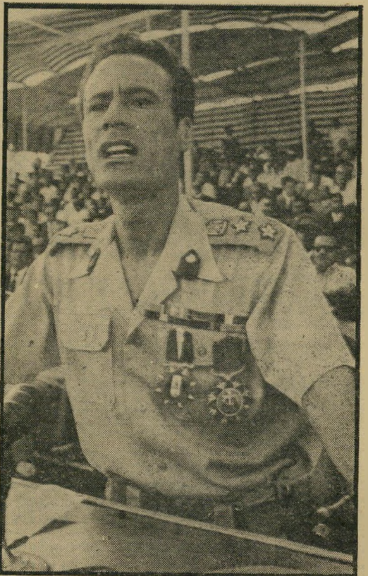
הנשיא קואי: למען פלסטין

הנה ההתפתחות: לפי החישובים הנוכחיים, יצטרך העולם המערבי לשלם לאותן הארצות, בשנת 1985, כ-300 ביליון דולר, כדומר: פי שלושים.