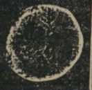
Herod Antipas (Reif. 46a)

A. 3 Bronze Herod Antipas (Reif. 45, 46A, 52) B. 3 Large Bronze of Herod Agrippa II (Reif. 83, 84, 87)