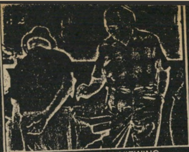
GENERAL DAYAN VIEWING THE COLLECTION WITH A COLLECTOR (back toward camera)

There was a small province of the Empire of Rome called JUDAFA