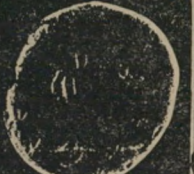
Large Bronze M-169

A. 4 Tetradrachms (sela) B. 8 Denarii (zus) C. Year 1 Eleazer Denarius (Reif. 169) D. Medium Bronze (Reif. 192) E. Large Bronze (Reif. 169)