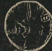
Year 2 Tetradrachm (Reif. 164)

A. 4 Tetradrachms (sela) B. 8 Denarii (zus) C. Year 1 Eleazer Denarius (Reif. 169) D. Medium Bronze (Reif. 192) E. Large Bronze (Reif. 169)