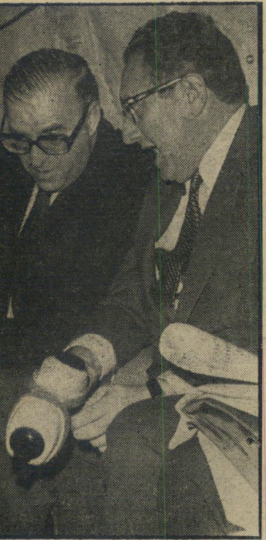
קיסינג'ר עם אבן במסוק הצעה סודית

התקשר עימנו — קבל חומרי-הסברה — רח' בריכוכבא, 71, טלפון 283288/9, תל-אביב.