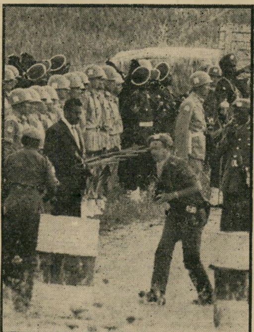
1967: חיל האו"ם מסתלק

בהחלט לא. רק מי שחי עדיין בתקופת "חומה ומגדל" של 1938 יכול להאמין בכך. אנשים כמו גולדה וגלילי אכן חיים, כנראה, בתקופה זו. מאורעות יומיהכפורים 1973 הוכיחו שי-ההתנחלויות היו מיששונ ממודרגה ראשונה להגנה על השטחים. צה"ל נאלץ להקדיש כוחות חילוניים כדי לפנות את ההיאחזויות כי-רמת-הגולן, כדי למנוע את השמדת התושבים. הישועים לא תרמו את התרומה הזעירה ביותר להגנה על הרמה, אלא להיפך, היקשו עליה. אילו פתחו הירדנים במילחמה, היתה אותה בעייה נוצרת בביקעתי-הירדן. להתנחלות אין תפקיד ביטחוני, אלא פוליטי. היא באה לתת בידי הממשלה, בבוא היום, את האפשרות לומר: