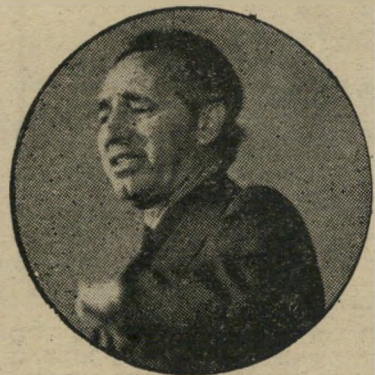
האיש המעונה: שמעון פרס

מרכז מיפולגת העבודה התכנס כדי לאשר את התבטול בן 14 הי סעיפים. הישיבה היתה סוערת, הי שחקנים התרגשו — אך היה זה מחזה מבוים — שהוסכם מראש.