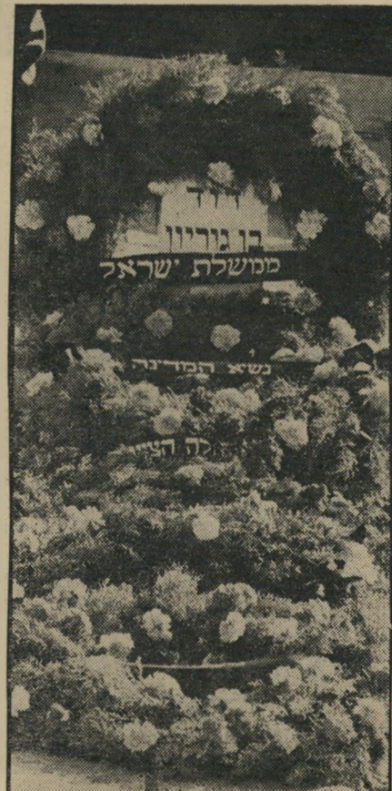
זרי הכרחים על הקבר ארונו של בן-גוריון נשמן באחוזת-הקבר בשדה בוקר ליד קיבוצה של פולה