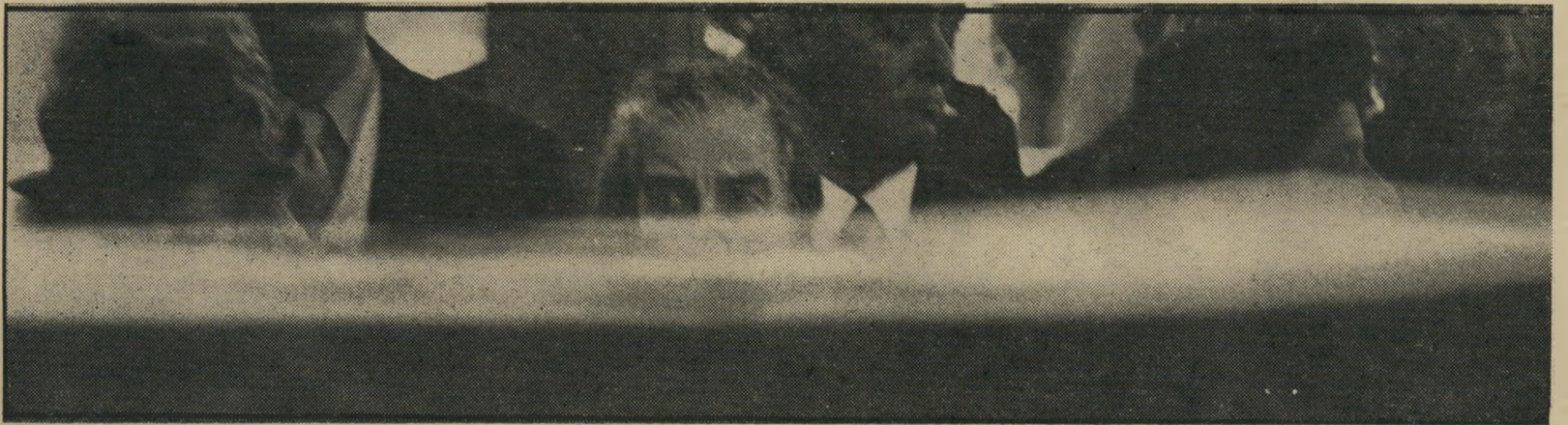
כרידה מחבר - ארונו של בן-גוריון חולף על פניה של ראשי-המשלה גולדה מאיר