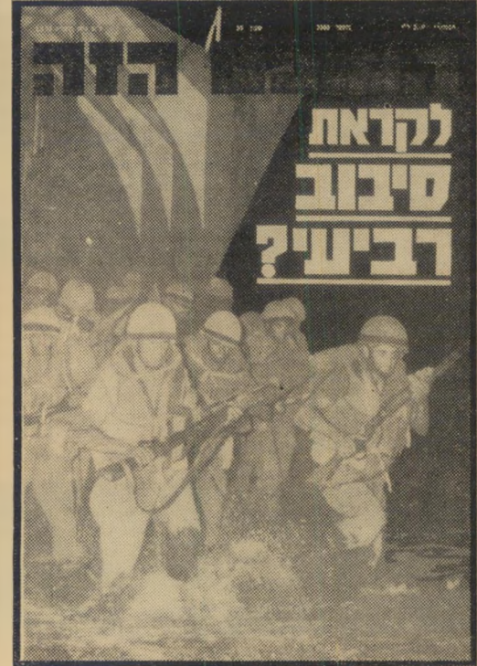
שער "העולם הזה" 1.5.73 אזהרה

מי שמצוי בידי אותו גיליון, כדאי שיעיין מחדש בכ"ת בה "סאדאת מחכה לדדו - אי! אי! אי!", שפורסמה באותו גיליון, אני מצטט רק מיספר קטעים לדוגמא: