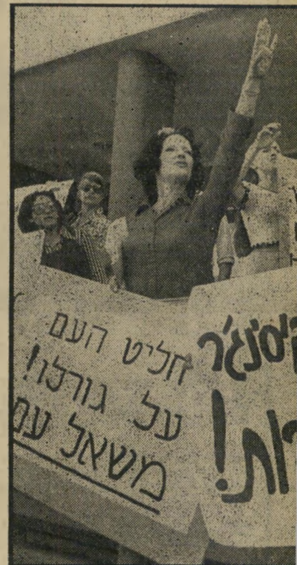
מפגינה נגד קסינג'ר - הייל - למי?

* השלט אומר: "רק ניצחון ינקום את שבויונו שנוצחו".