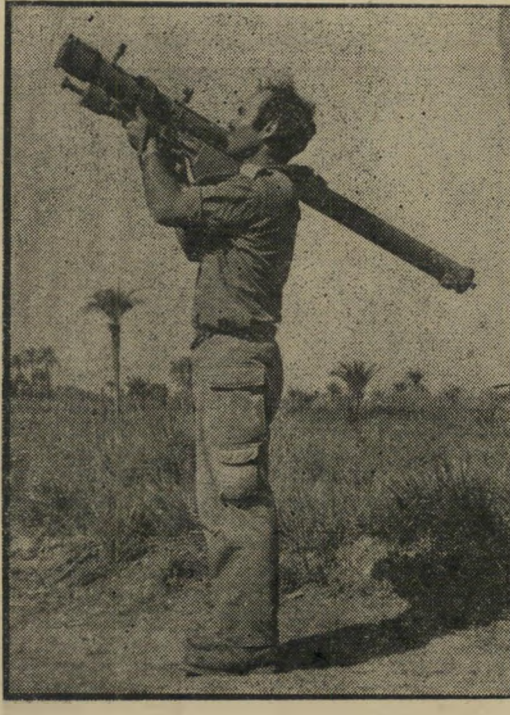
החידוש: טיל-כחף נ. מ. מדגם סטרלה שותפס

לבוא. לפחות ביומיים שלושה, בגלל חששות מוגזמים לגבי סיכויי הפריצה. בינתיים נלחם כוח השיריון היש' ראלי שניצב מול השיריון המצרי מיורחית לתעלה. ב' קרבות מגע חזיתיים ונאלץ להתמודד עם כוחות שתוג' ברו כמעט פי שתיים בתקופת ההמתנה. אלה מאמינים גם שכוח העתודה המצרי שנשא' עדיין בגדה המערבית של התעלה בשבוע השני למלחמה, לא יכול היה להכ' שיל את הפריצה. כוח זה לא היה ערוך במערך הגנתי, כיוון שהמצרים לא העלו כלל בדעתם, אחרי ההישגים שהושגו על ידם אפשריה של פריצה נועזת אל מעבר לקוויים. כוח העתודה המצרי, אמרים אותם משיקפים, היה ערוך לצליחת התעלה ולתפיסת גיורות בגדה המי' רחית. הקדמת ההתקפה היתה מאפשרת לחסל כוח זה לפני שהספיק לצלות את התעלה.