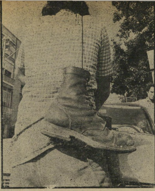
הגיוס: מדוע היה איחור בקריאת המילואים?

רמו להבדלי ההשקפות הקיימים בשאלה זו בין המומחים ניתן בדבריו של הרמטכ"ל השבוע הראיון ש' העניק לטלוויזיה. בו טען כי המיתקפה בחזית הדרומית לא נערכה מוקדם מדי ולא מאוחר מדי. רב-אלוף אל' עזר טען באותו ראיון, כי אילו הקדימה הפריצה למצ' ריים והקמת ראש-הגשר מערבית לתעלה לבוא, כי או היה צה"ל נתקל בעתודות הכוח המצרי שנשארו בגדה המערבית לפני שהספיקו לצלות מורחה, דבר שיהיה מק' שה את הלחימה בגדה-המערבית. לעומת זאת יש הסבורים כי מיתקפת-הנגד אחרת