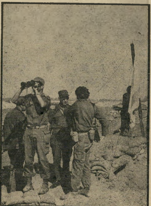
מכת'הוגד: דגל 'ישראלי' במוצב מצרי

היו סיקודיו בעבר. השאלה אם נבון היה למנות כמפקד תזית זו אדם ששמו נקרא על מערכת ההגנה שהתמוטטה מול עיניו ושיוקרתו היתה מונחת על כפות המאזניים בשל כך, היא כבר שאלה אחרת. אם לא היו הדחות הרי חילופי סמכויות כן נערכו. כך, למשל, הוחלפה האחריות למערך ההסברה של צה"ל בימי המלחמה מיספר פעמים.