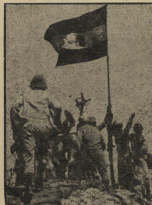
המכה: דגל מצרי במעוז