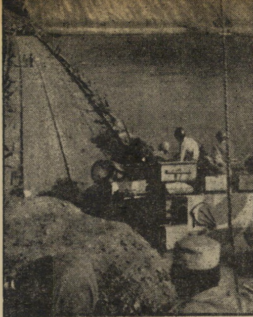
ההפתעה: המצרים צולחים את תעלת-סואץ

במילחמה זו נוצרו מצבים חדשים ובלתי צפויים ש-