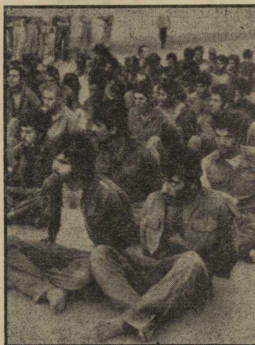
התמוטטות: אנשי המעוזים של קו ברילב בשבי המצרי