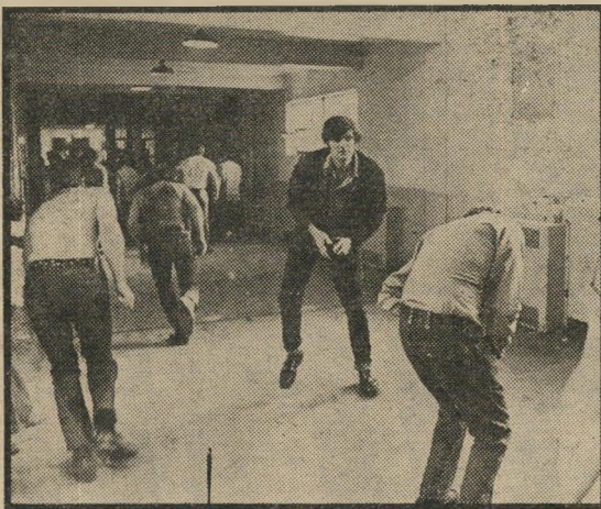
אלדה — פרופסור מגן על חייו

מנסים לשפר אותו, בא בסוף הסרט, בדברי מנהל הכלא. בין שני הקצוות הללו מגיש הבמאי טום (מאה רובים) גריס, דרמה ערוכה היטב, חסרת פשרות, מזועזעת, ומשו-חקת היטב.