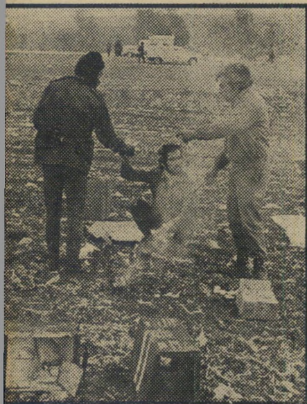
ארוחת בוקר בשדה הפתוח ברמת השרון, היחידות הלוחמות, לוגמים משקה חם במטבח מאולתר בשדה. הצד החששות בעורף כאילו סובל הצבא מחוסר מזון, נעדר עברו בבתים בערים השונות וביק