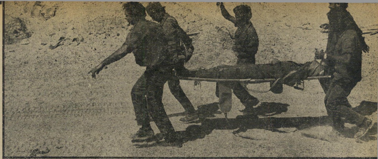
להמשך הטיפול הרפואי בבית-חולים. חיי כל חייל חשופים ושוב מושקע מאמץ עליון להצלת כל פצוע. בתום שמונת ימי הקרבות נשארו 2000 לוחמים פצועים מאושפדים בבתי-החולים.