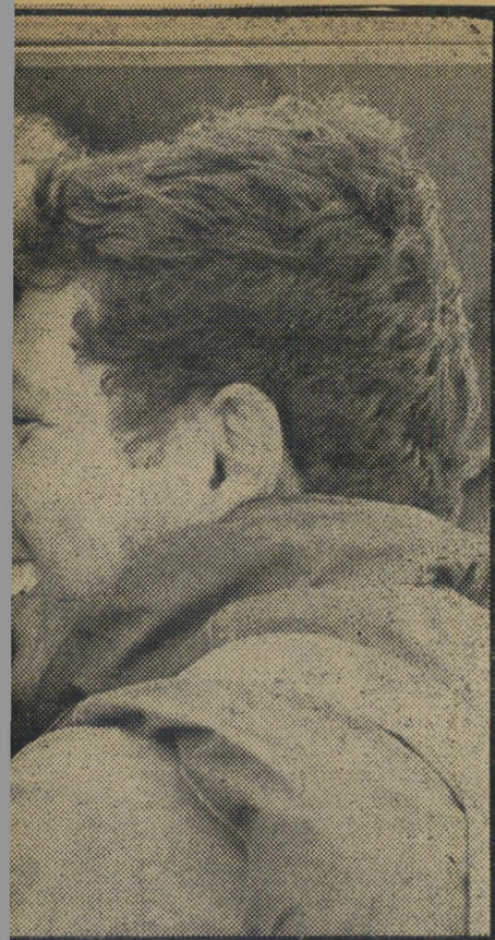
שימחת הפגישה חיוכים את שימחת הפגישה, שחזר מהקרוב. התמונה שצולמה את חברם הלוחם, שחזר מהקרוב. התמונה שצולמה