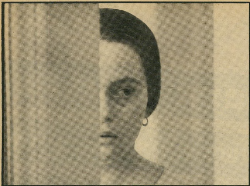
4. זעקות ולחישות (שוודיה)