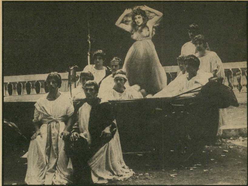
3. פליני - רומא (איטליה)