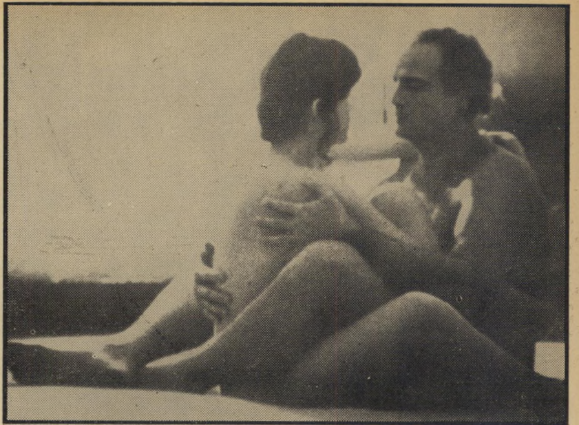
1. טאנגו אחרון בפריס (צרפת)