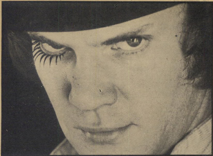
2. התפוז המכאני (ארה"ב)