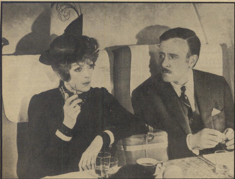
2. מסעות עם דודתי (אנגליה)