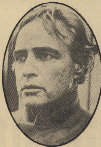
שחקן השנה: מרלון בראנדו "הסנדק", "טאנגו אחרון בפריס"

(המשך מעמוד 37) מאלקולם מקדואל, השחקן הצעיר ש־התגלה ב"....והיה אם", כבש את עולמו כאלכס, התגלמות האלימות, ויחד עם זאת דמות אנושית ב"תפוז המכני". הוא עתיד לזכות להצלחה גדולה עוד יותר בשנה הבאה בעקבות "איש ברימוד" של לינדזי אנדרסון.