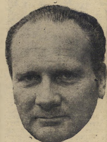
יועץ מישמטי שמגר נגד החלשים — תקיפות

● כיוון שלא היה לו כסף פנוי, וכיוון שלא רצת למכור את דירתו בירושלים כדי לממן את רכישת הדירה בתל-אביב, החלי-טה הוועדה המיוחדת של הבנק לפיתוח