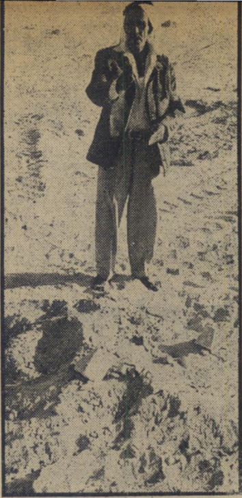
שדהיקברים הרום כאתר ימית מנסים לרמות את כל המדינה

קיבלו צווייפניו לראשית נובמבר שנה זו. שבוע קודם לכן הופקד משמר צבאי בכניסה לאזור, אסר על אורחים את הי הכניסה. עקפנו את נקודת-המשמר, נכנסנו לשטח. לאחר מכן חזר המושל הי צבאי את פעילי כרם-שלים כי אם ייתפסו בשטח — ייאסרו.