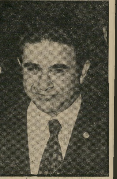
ממונה נוידרפר החלפה בישראל

הפקידים פתחו במיתקפתם החדשה בעיקבות המידע שהגיע לידיהם במי"ס גרת תפקידם אודות הקשיים הכספיים שאליהם נקלע ליברמן לאחרונה. לחצם זה מתואם עם הבטחתו של פנחס ספיר לרוזוב לעזור לו לזכות במנופול בתח"מו בארץ — כפי שעזר לקבוצת עליה להפוך למנופול בתחומם שלהם.