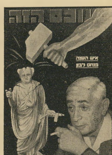
איש השנה תשכ"א מודח לבן