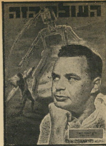
איש השנה תשמ"ז פרקליט תמיד