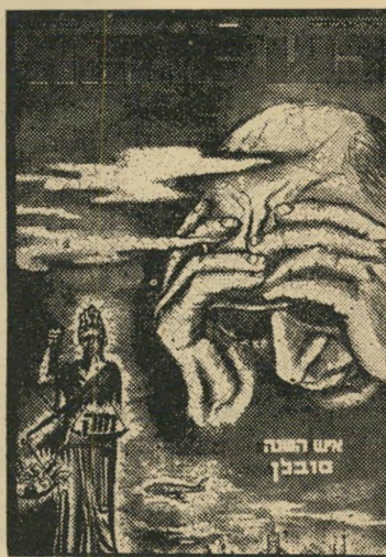
איש השנה תשכ"ב יזרעו סובלן