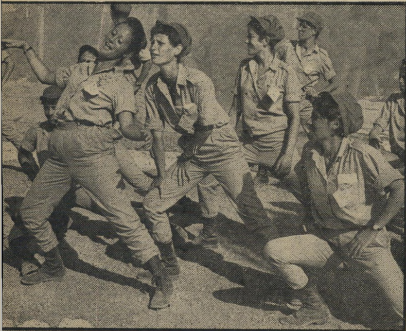
יחידת ח"ן בתרגונו הרפיה בתום יום הצעדה הראשון חתיכים וחתיכות מכל רחבי הארץ

ב-1956 התמנה מנהל אגף התקציבים. כעבור שנתיים עבר לתפקיד יועץ כלכלי (המשך בעמוד 26)