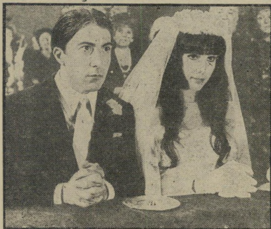
סנדרלי והופמן: נתחתן ונתגרש

בקיצור, הרפתקאות ואלתר מיטי מודרני זה החי בהזיות, ושוגה בחלומות נוסח ז'אן לוק גודאר, יבדרו את מי שמתמצא בחומר הקרוב לליבו של הגיבור בסרט.