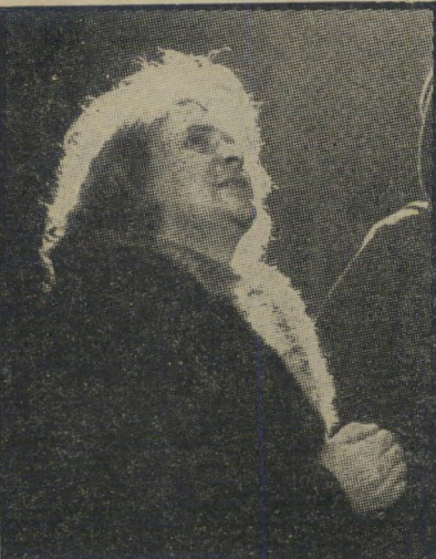
כמאי ראסל משיח הפרא

דאסטין הופמן נראה כבחירה אידיאלית לתפקיד הראשי, כשפניו המיואשות מביעות את ההיפך ממה שאו־מר קולו בפס־קול. ניווד זה בין המילה המדוברת לבין התמונה אינו אלא תכסיס נוסף של ג'רמי ללעוג לגיבוריו.