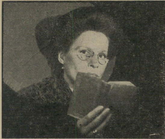
טולין: הרס עצמי

בסוף חודש זה עומדים סירטי נוח לפי תוח בכניין שעל הטיילת התל־אביבית שני בתי־קולנוע חדשים: סינמה 1 וסינמה 2 (כנראה בהשראת קדמי בלונדון). הראשון, שהוא פחות או יותר האולם